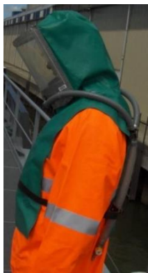
Draag de juiste PBM's